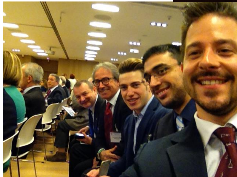
Selfie al convegno di "ragazzi" giovani e giovanissimi