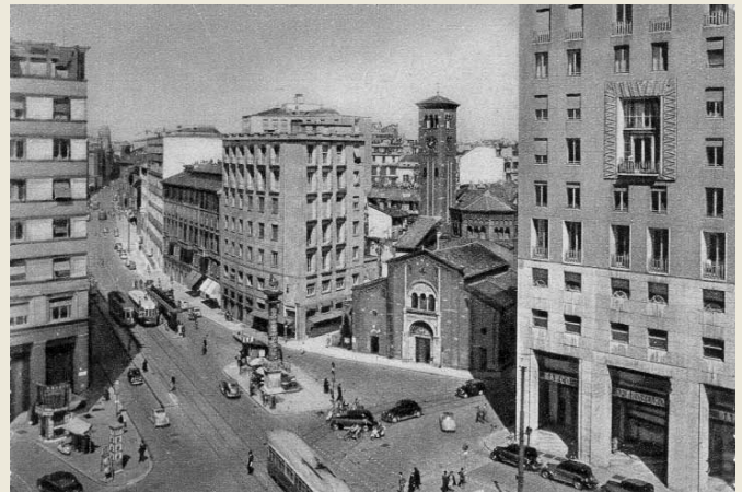
Milano, piazza San Babila.

In seguito lo stesso ing. Culleton stabilì delle relazioni col Rappresentante speciale del Rotary Internazionale per l'Europa signor Fred Warren Teele, che presenziò poi, nel novembre del 1923, all'inaugurazione del Rotary Club di Milano. In questa occasione il signor Teele ebbe a dichiarare che il Consiglio direttivo del Rotary Club di Milano, essendo quest'ultimo il primo a formarsi in Italia, era, secondo la consuetudine del Rotary Internazionale, investito dei poteri per lo sviluppo dell'organizzazione rotariana nelle altre città. Il Consiglio del Club di Milano, quindi, all'atto stesso in cui il Club veniva ammesso ufficialmente al Rotary Internazionale, era da questi costituito in "Extension committee". Fra le sue principali attribuzioni, naturalmente, vi era quella