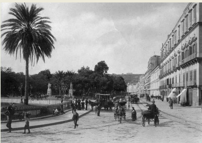
Napoli, Riviera di Chiaia.

Ora, successivamente, e cioè a mano a mano che gli altri Club si andavano costituendo, il Comitato di esten-